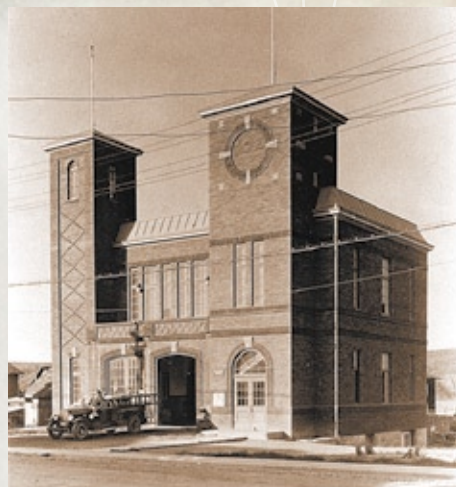
L'hôtel de ville de Bagotville

Cet édifice a été construit sur le terrain qu'occupait, depuis 1915, la caserne des pompiers. Commencés en 1926, les travaux ont été suspendus quelques temps puis, un programme gouvernemental d'emploi a facilité leur relance en 1930. En 1957, on a agrandi vers l'arrière en ajoutant une salle de réunion, des bureaux et le poste de police. Lors de la fusion municipale de 1976, cet édifice est devenu le centre administratif de Ville de La Baie. D'autres travaux exécutés dans les années 1980 lui ont donné une figure plus moderne.