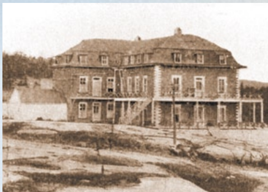
L'hôtel McLean

ment, un incendie l'a complètement détruit en 1924. Il fallait attendre l'ouverture des auberges d'aujourd'hui pour revivre l'hôtellerie de luxe à La Baie. À l'emplacement où se trouvait cet hôtel, le parc McLean, offre un coup d'œil époustouflant sur le fjord.