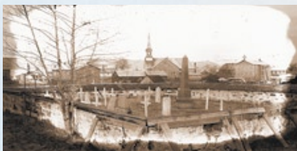
Le cimetière protestant début du XX e siècle