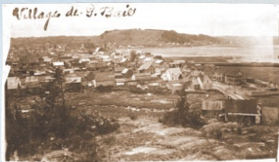
Village de la Grande-Baie