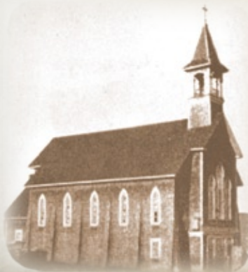
La première chapelle de Port-Alfred, 1917c (BAnQC-SHS-P2,S7, P10519)

Voulant plaire aux dirigeants anglais de la papetière, principaux bailleurs de fonds, on érige une église de style gothique anglais à Port-Alfred. La firme d'architectes Lamontagne, Gravel et Brasard en dresse les plans. Le nom de la paroisse honore à la fois l'initiateur de cette ville de compagnie, Julien-Édouard-Alfred Dubuc, et le roi d'Angleterre, Édouard le Confesseur (1042 à 1066). Le clocher placé à droite laisse croire qu'on souhaitait mieux s'affirmer du côté de Bagotville. Depuis janvier 2006, cette église n'est plus disponible pour le culte religieux catholique.