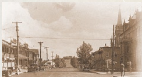
Boulevard de la Grande-Baie Sud, secteur Port-Alfred, depuis l'avenue du Port (Archives de la Ville de Saguenay, arr. de La Baie, 29-03-02)

La naissance de cette ville en 1917 est synonyme des débuts de la grande industrie à vocation internationale à la baie des Ha! Ha!. En sillonnant les rues et les avenues à « l'anglaise », vous remarquerez la division orthogonale du quartier et l'architecture inspirée des villes ouvrières de la Nouvelle-Angleterre.