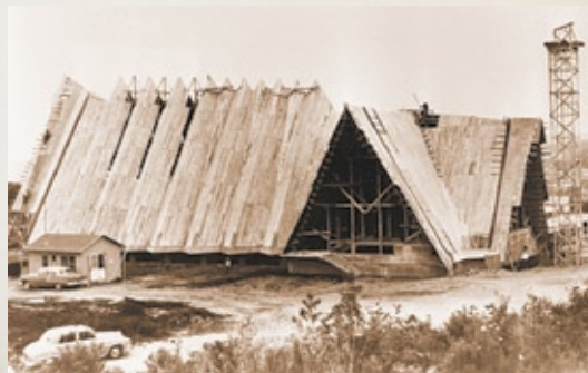
La construction de l'église de Saint-Marc

Chef-d'oeuvre de l'architecte Paul-Marie Côté, l'église de Saint-Marc représente l'un des plus importants monuments de l'architecture moderne québécoise. À l'avant-garde, cette construction suggérait un autel face aux fidèles, une première au Québec. La photographie de l'église de Saint-Marc a circulé à travers toute l'Europe et les prouesses techniques déployées lors du chantier ont attiré l'attention sur une première; la fabrication d'une dalle de béton plissée. En janvier 2006, une dernière célébration catholique a eu lieu à l'église de Saint-Marc; celle-ci est dorénavant la propriété d'un groupe évangéliste.