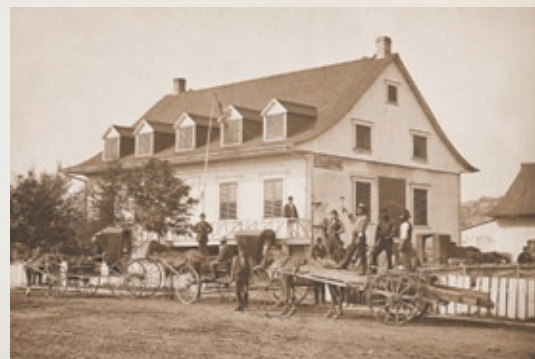
La maison Lepage