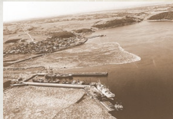
Vue aérienne des installations portuaires, 1938 (BAnQC-SHS-P2,S7,10.1-p10)

En 1924, Dubuc est acculé à la faillite. La Compagnie Aluminium du Canada fait l'acquisition des actifs de la Compagnie générale du port de Chicoutimi et de la compagnie de chemin de fer Roberval-Saguenay . Cet achat permet à Alcoa d'alimenter sa nouvelle usine d'Arvida en matières premières. On construit ensuite deux nouveaux quais qui assurent les opérations d' Alcan dans la région : le quai Duncan (1937-38), destiné à l'importation de vracs liquides (l'huile, le caustique et le mazout) et secs (principalement la bauxite, l'alumine et le coke vert) et le quai Powell (1947-48), servant à l'exportation des marchandises finies et semi-finies vers l'étranger.