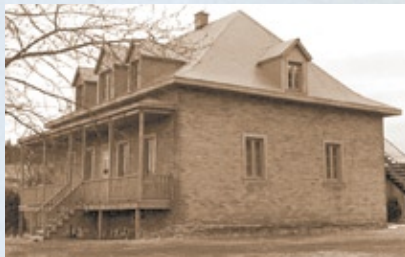
La maison John Kane