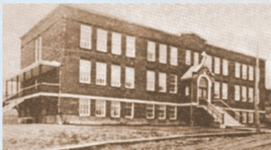
Le collège Saint-Édouard, 1930c.

En 1927, le nombre croissant d'étudiants justifie la présence d'un nouvel établissement scolaire à Saint-Édouard. Ce collège, dirigé par les Frères des Écoles Chrétiennes, était fréquenté par 227 garçons. En 1929, on agrandit pour loger les frères enseignants. D'autres agrandissements ont eu lieu en 1937, puis en 1947, pour l'ouverture de l'École technique. Avec l'arrivée de la Polyvalente de La Baie dans les années 1970, on a transféré la formation technique à cet endroit.