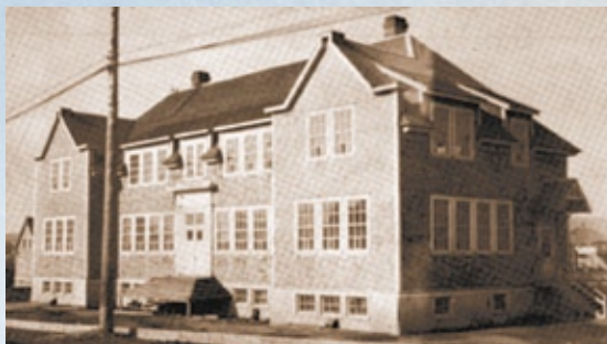
L'école Notre-Dame, 1918c (50 e Anniversaire de la Ville de Port-Alfred, 1967,)

reconstruction en 1940. En 1952, on l'a nommé école Médéric-Gravel en reconnaissance envers le curé fondateur de cette paroisse.