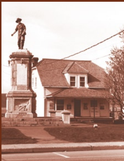
Monument des Vingt-et-Un devant le musée Mgr Dufour

Ville de Saguenay Capitale culturelle du Canada 2010