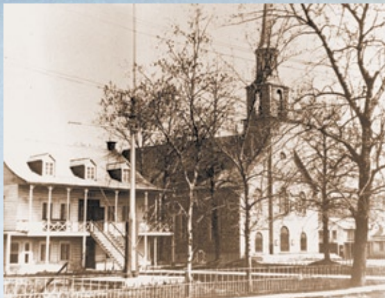
L'église de Saint-Alphonse et le premier presbytère, 1900c (BAAnQC-SHS-P2,S7,P09253)