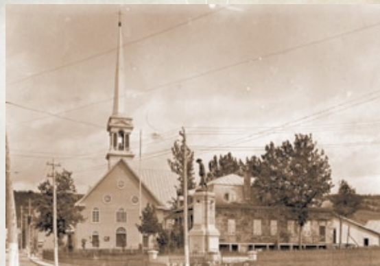
L'église, le presbytère de Saint-Alexis et le monument des Vingt-et-Un, 1940c

le presbytère loge un économusée et a conservé sa vocation communautaire.