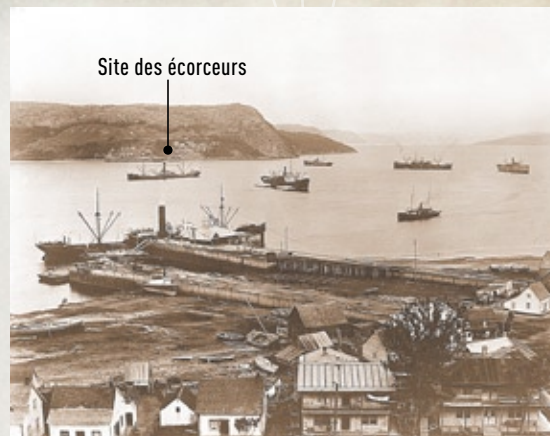
Le port de Bagotville, 1910c

Construit en 1859, le premier quai de Bagotville servait pour à l'accostage des goélettes et des bateaux légers. En 1876, devant la vocation portuaire de Bagotville, le gouvernement fédéral achète ce quai. On s'est alors doté des infrastructures nécessaires à l'importation et l'exportation des produits de consommation, parmi lesquels le bleuet occupait un créneau important. En 1905, l'homme d'affaires Agésilas Lepage fait construire un quai adjacent à celui du gouvernement. À partir de 1930, le quai connaît une période faste avec les croisières de la Canada Steamship Lines et ses « bateaux blancs ». Autour de 1938, le quai érigé par Lepage est vendu au gouvernement fédéral. Afin d'accueillir les bateaux de croisières, la construction d'une nouvelle infrastructure débuta en août 2007.