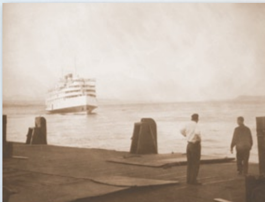
Arrivée d'un bateau de croisière à Bagotville

Au milieu des années 1820, le Bas-Canada est frappé par une crise sociale importante causée par une surpopulation des seigneuries. Cette crise atteint son apogée en 1837-1838. Afin de remédier à cette situation difficile et de contrer l'exode vers les États-Unis, on demande aux autorités d'ouvrir de nouvelles terres à la colonisation. C'est ainsi que des Charlevoisiens réclament la permission de s'établir au Saguenay.