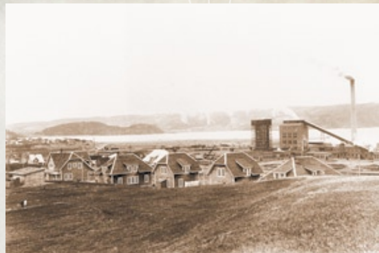
Les débuts de l'usine, 1918c