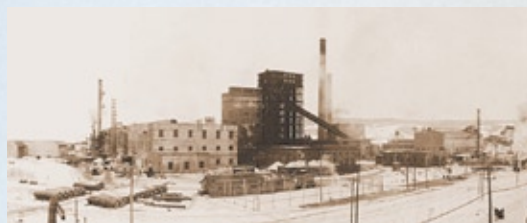
L'usine de Port-Alfred, 1926